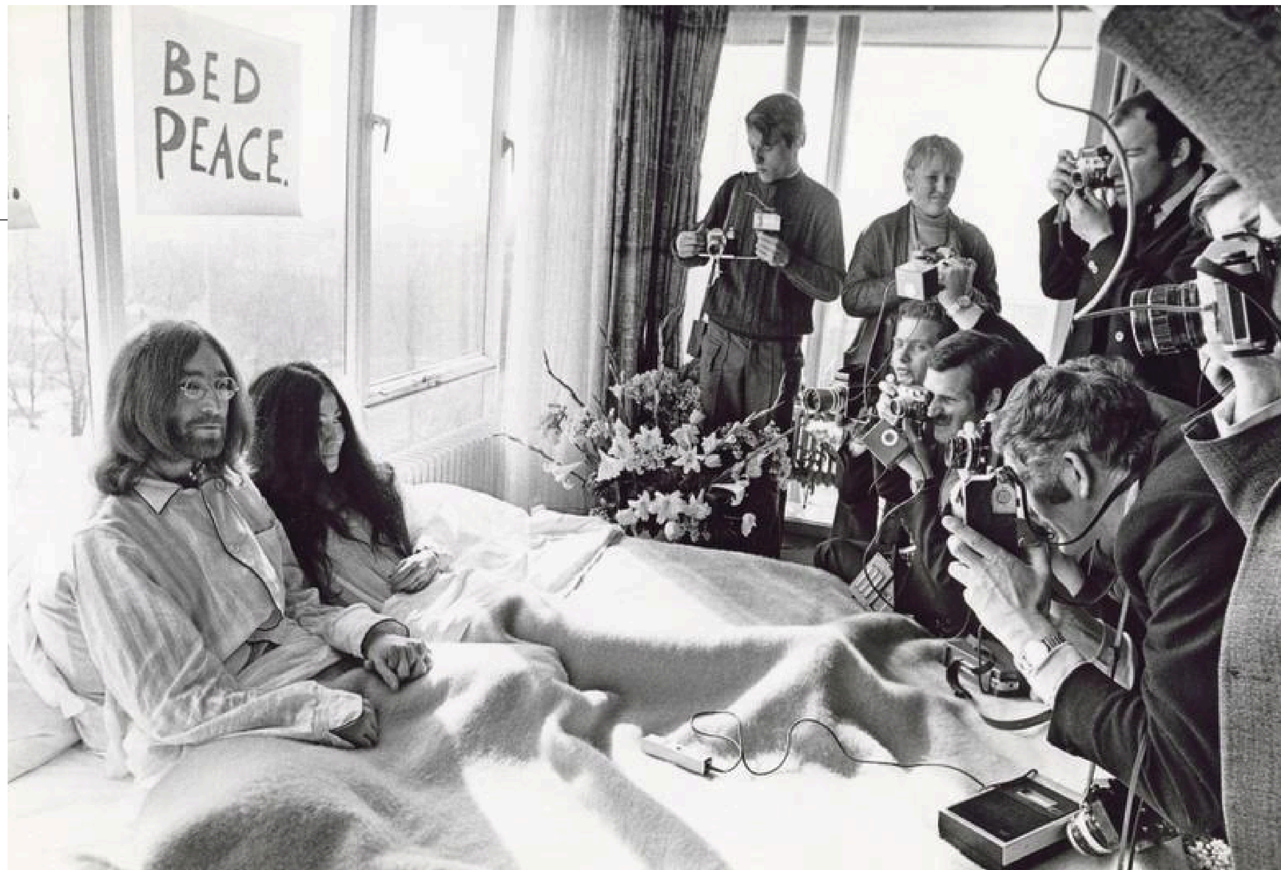
Amsterdam, maart 1969: John Lennon en Yoko Ono vragen tijdens hun huwelijksreis in het Amsterdamse Hilton Hotel aandacht voor de vrede. De wereldpers rukt uit.