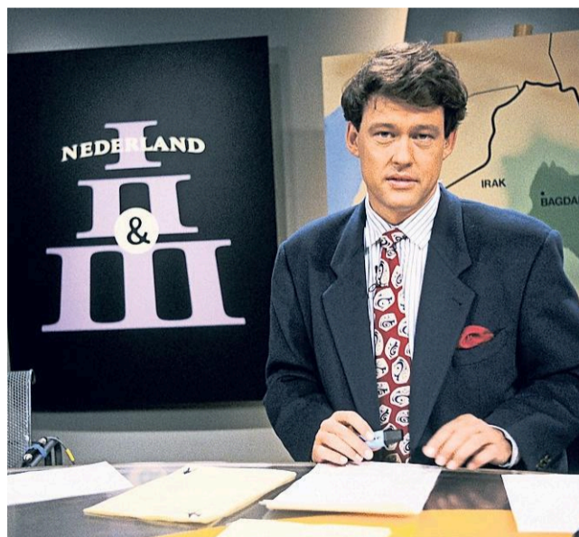
1990: Tekst en uitleg over de Golf-oorlog.