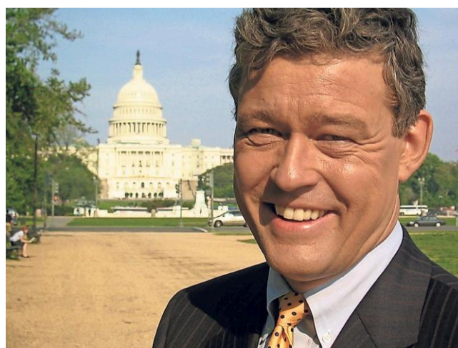
In 2003 bij het Capitool.