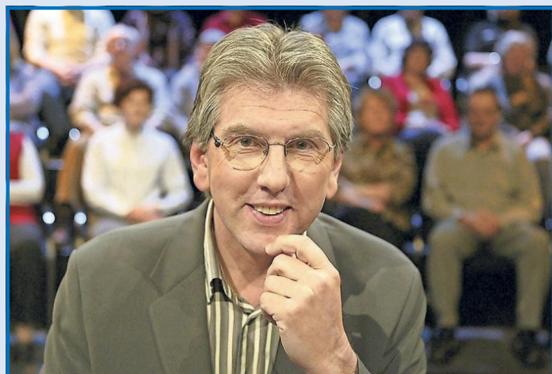
Felix Meurders als presentator van 'Kassa' van de VARA in 2004.