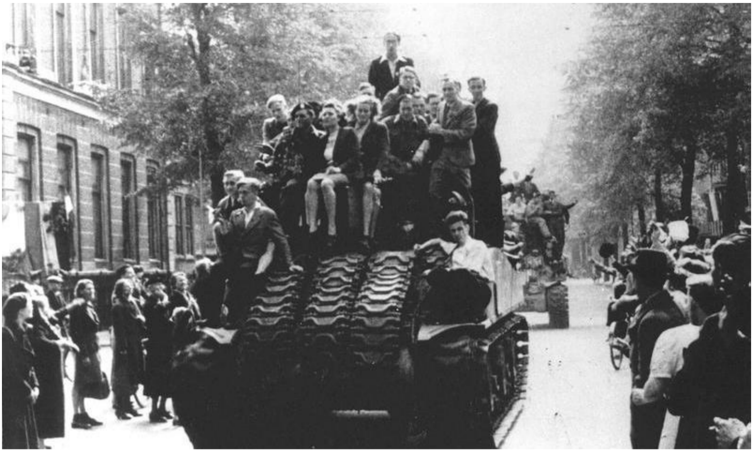
Mei 1945: uitzinnig van blijdschap verwelkomen Nederlandse meisjes na vijf jaar oorlog Canadese bevrijders in ons land.