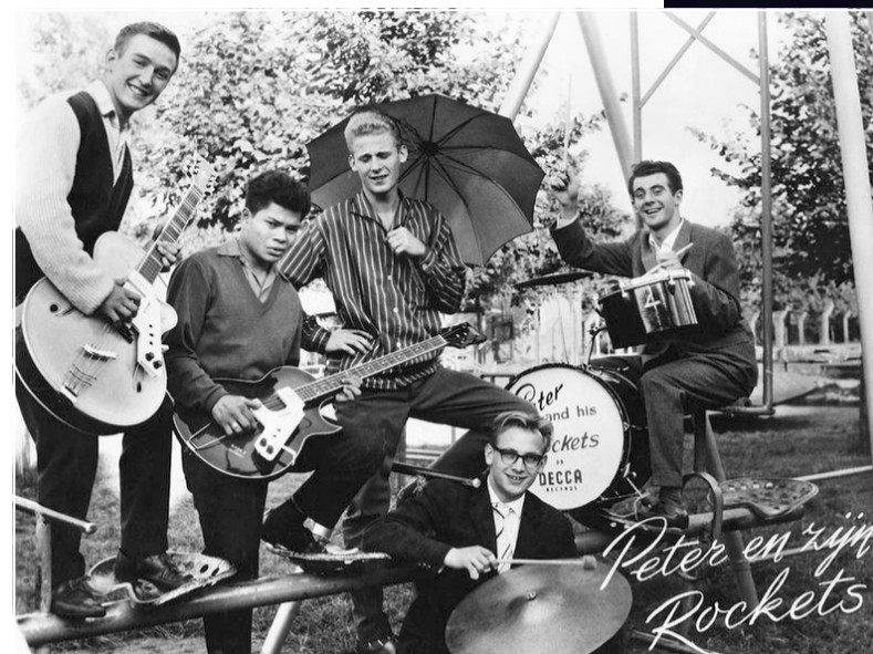
In 1960 met zijn Rockets.